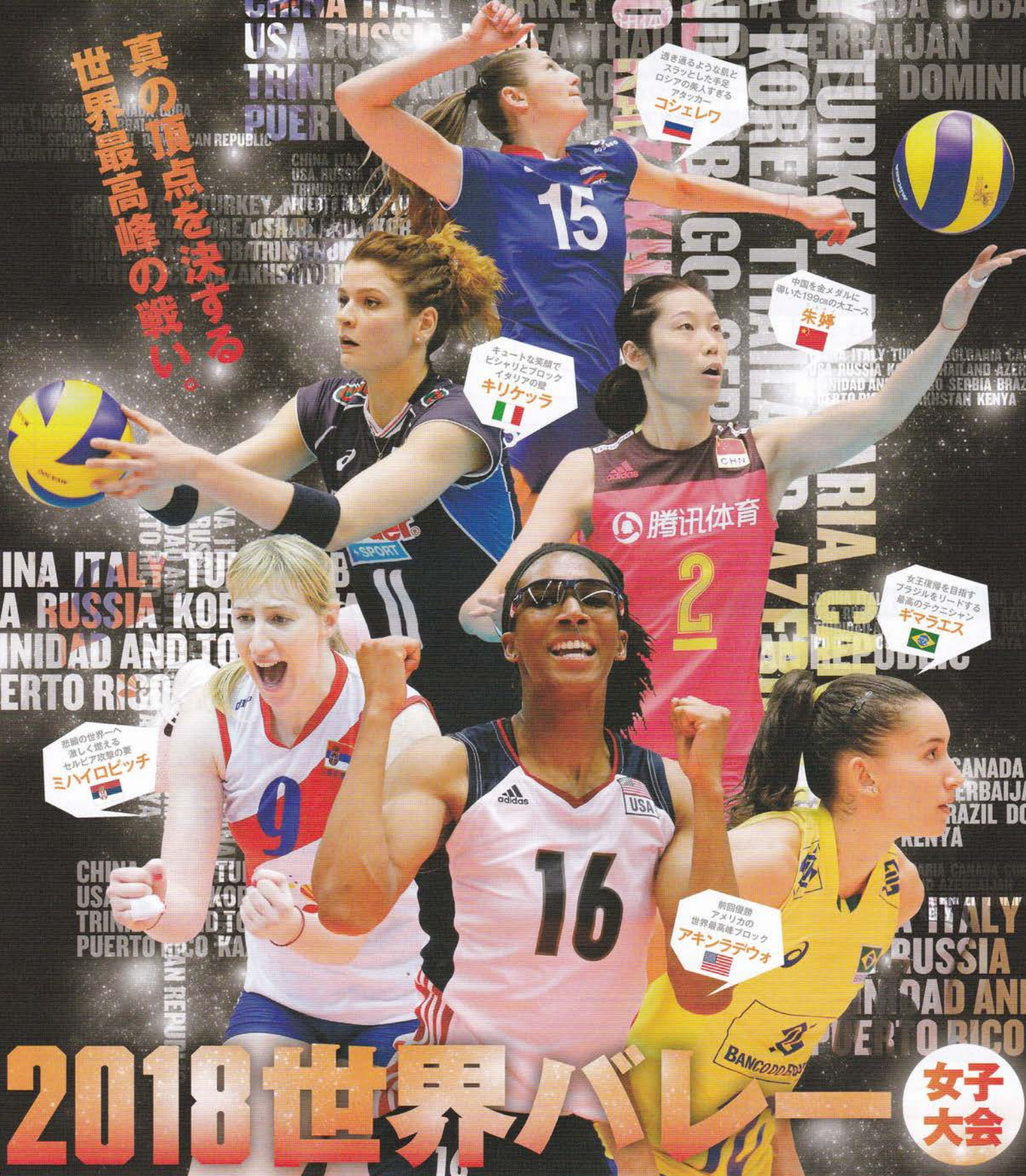
動き回るような顔と スラッとした手足 ロシアの美人すぎる アタッカー ゴシエレワ